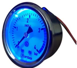
1 Manómetro 52mm 0 a 4 bar